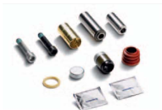
Zestaw naprawczy zacisku hamulcowego już od: 300,00