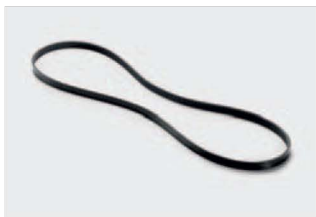
Pasek klinowy żebrowany 8pk1920 już od: 150,00