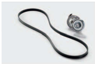
Komplet napinacz i pasek już od: 460,00

Rozpoczęliśmy kolejną kampanię sezonową, w której skupiamy się na poprawie stanu technicznego i bezpieczeństwa pojazdów. W kwestiach kluczowych dla bezawaryjnego funkcjonowania pojazdów ciężarowych, jakość jest najważniejsza.