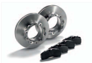
Zestaw klocków i tarcz hamulcowych na oś już od: 1 250,00

Okres trwania promocji od 01.04-30.06.18