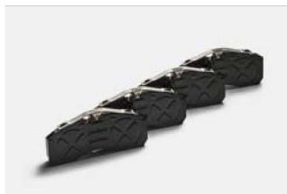
Komplet klocków hamulcowych już od: 395,00