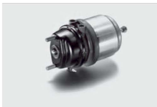
Siłownik hamulcowy już od: 825,00